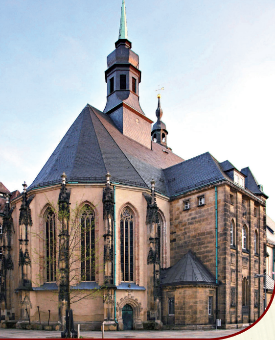
St. Jakobikirche Chemnitz