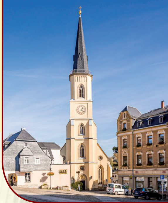
St. Jakobikirche Stollberg