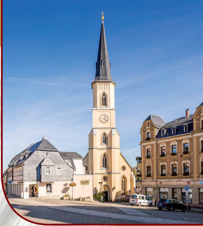
St. Jakobikirche Stollberg