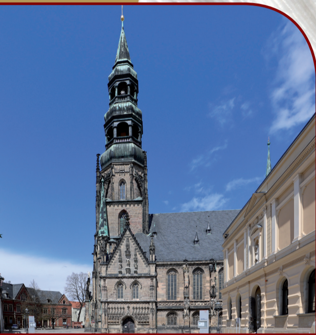
Dom „St. Marien“ Zwickau