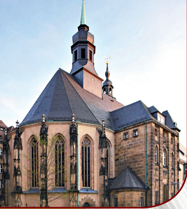
St. Jakobikirche Chemnitz